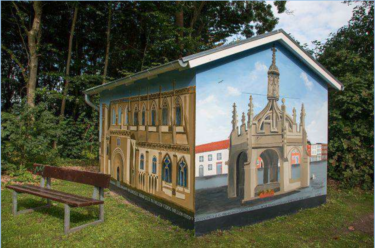
Das Gerätehaus, Foto vom 03.09.2017