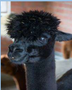
Alpaka Loretta

Mai Dienstag, 17.05.2022 – 14:30 Uhr ZOB-Niebüll Besichtigung und Vortrag Alpakahof Qorikancha Preis für Mitglieder und Gäste: 29,50€ / Person Anmeldung bis zum 03.05.2022